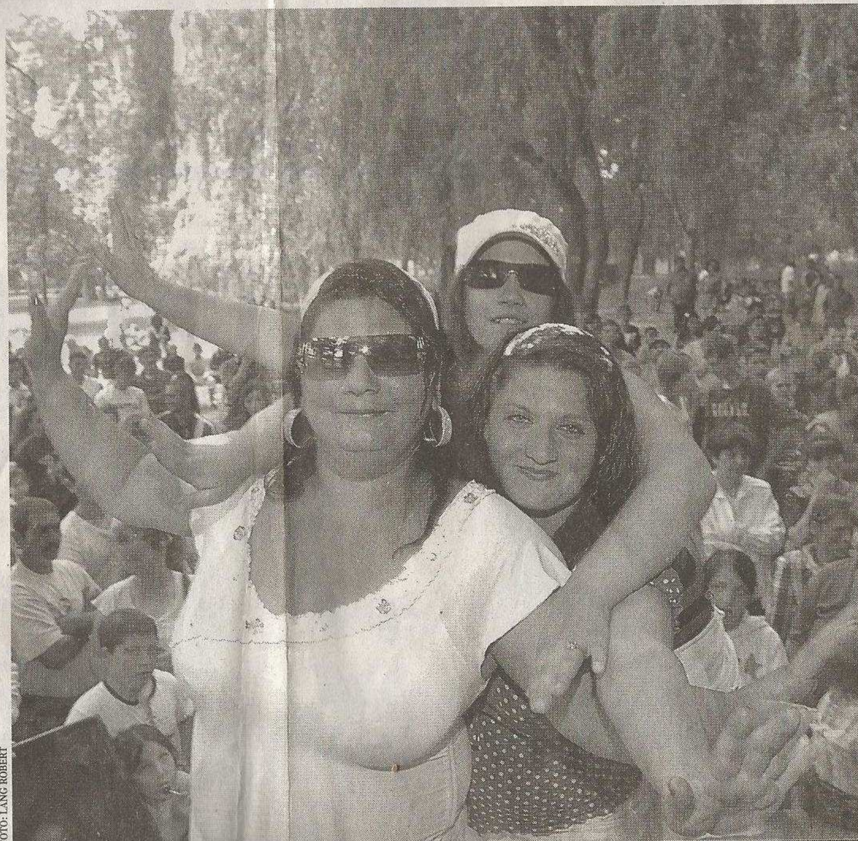
Több mint ezren látogattak ki a Deseda toponári strandján rendezett megyei romanapra

Akik a harmadik alkalommal megrendezett megyei romanap egyik legnagyobb sikerét aratták. A jó ezerfőnyi publikum ráadást követelve tombolt a Deseda toponári strandján felállított színpad előtt. Mások a büfék előtti asztaloknál pihegtek jóllakottan - a szombaton korán reggel kezdődött főzőverseny résztvevői pincepörkölttel, babgulyással és gomba mellé tálalt punyával - cigánypogácsával - traktálták a vendégeket, akik